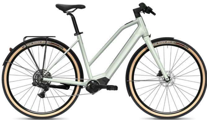
3.10 Mixed, Frosty Sage Gloss