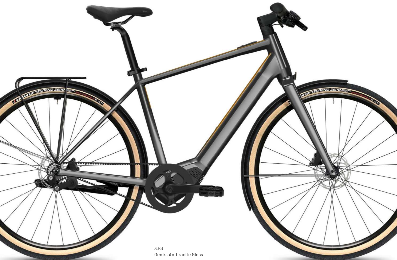
3.63 Gents, Anthracite Gloss