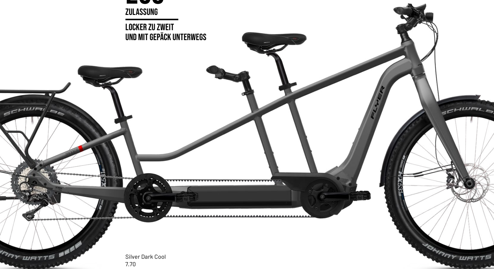
Silver Dark Cool 7.70

LOCKER ZU ZWEIT UND MIT GEPÄCK UNTERWEGS